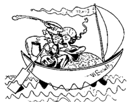
Das Pärchen aber, froh und heiter, Entflieht per Schiff und segelt weiter.

Verführerischer Charme und Eifersucht, Drohung und am Schluss die dringlichste Todesangst sind das glanzvolle und grausame «Land», in das Konstanze und Belmonte geraten sind. Dieses Land ist, zeitbedingt und gewiss politisch nicht korrekt, das muslimische Morgenland, aber es ist auch pure Seelenlandschaft. Diesem Land gehört der Bassa zugleich an und nicht an. Er ist ein Renegat, ein der christlichen Welt entfremdeter Abendländer. Und in dieser, im Libretto herausgestrichenen doppelten