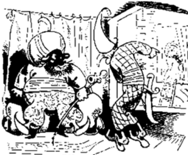
Der ruft: »Herr Sultan, kommt in Eil! Grad steigt da wer in das Serail!«

Das gilt mir nun ganz gleich. Da es einmal gestorben sein muss, ist mir alles recht.»