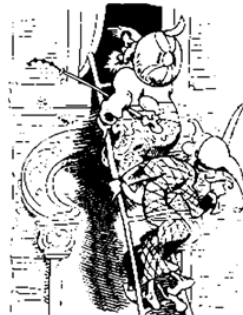
Die beiden Türken steigen nach Bis zu Zuleimas Vorgemach.