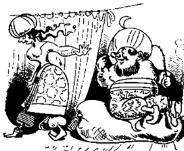
Der Sultan winkt – Zuleima schweigt Und zeigt sich gänzlich abgeneigt.

Es gibt mehrere Einwände. Zum einen gibt es in der Zeit auch die Faszination des Orientalischen und die «alla turca»-Mode, an der Mozart ebenfalls Anteil nimmt. So Hass gesteuert scheint das Türken-Bashing nicht gewesen zu sein und wie weit es «politisch» verstanden sein wollte, ist noch die Frage. Zum anderen sollte man nicht