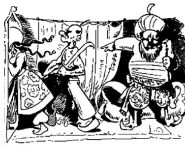
»Ha!« ruft der Sultan zorn'gen Muts, »Führt sie hinweg!!« – Der Sklave tut's.