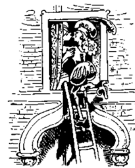
Hier grüßt man sich voll Zärtlichkeit – Gebt acht! der Aga ist nicht weit!