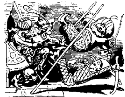
Kaum sind die beiden Türken oben, Da wird die Leiter umgeschoben.