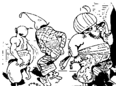
Dem Sultan aber klopft das Herz Vor Herzenspein und Nasenschmerz.