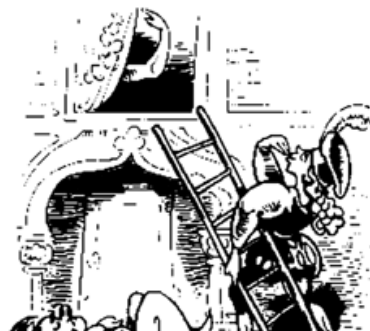
Jetzt ist die Schildwach' schon betrunken, Und schau! Zuleima hat gewunken.