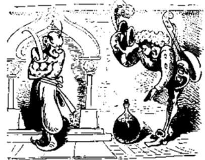
Der Ritter Artur sucht voll Tücken Des Hauses Wächter zu berücken.

ausser Acht lassen, dass es sich beim Stück um ein Singspiel handelt, das im weiteren Sinn zur Gattung der Komödie gehört. Osmin ist ein komischer Charakter, oder zumindest eine Karikatur im Rahmen eines künstlerischen Werks. Es ist recht seltsam, einem solchen Produkt des 18. Jahrhunderts den Mangel an political correctness vorzuwerfen und für uns heute zu glauben, die Meinungs- und künstlerische Freiheit und damit das Recht auf Satire und Karikatur als Grundlage der liberalen Welt verteidigen zu müssen.